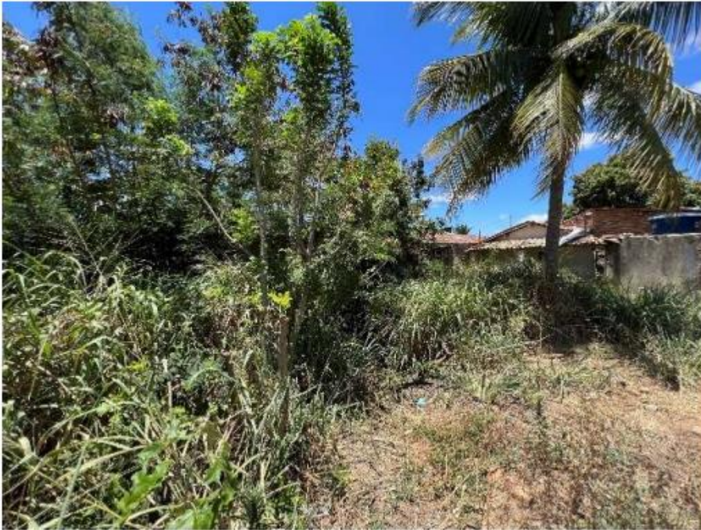
Imagem 4: Quintal.