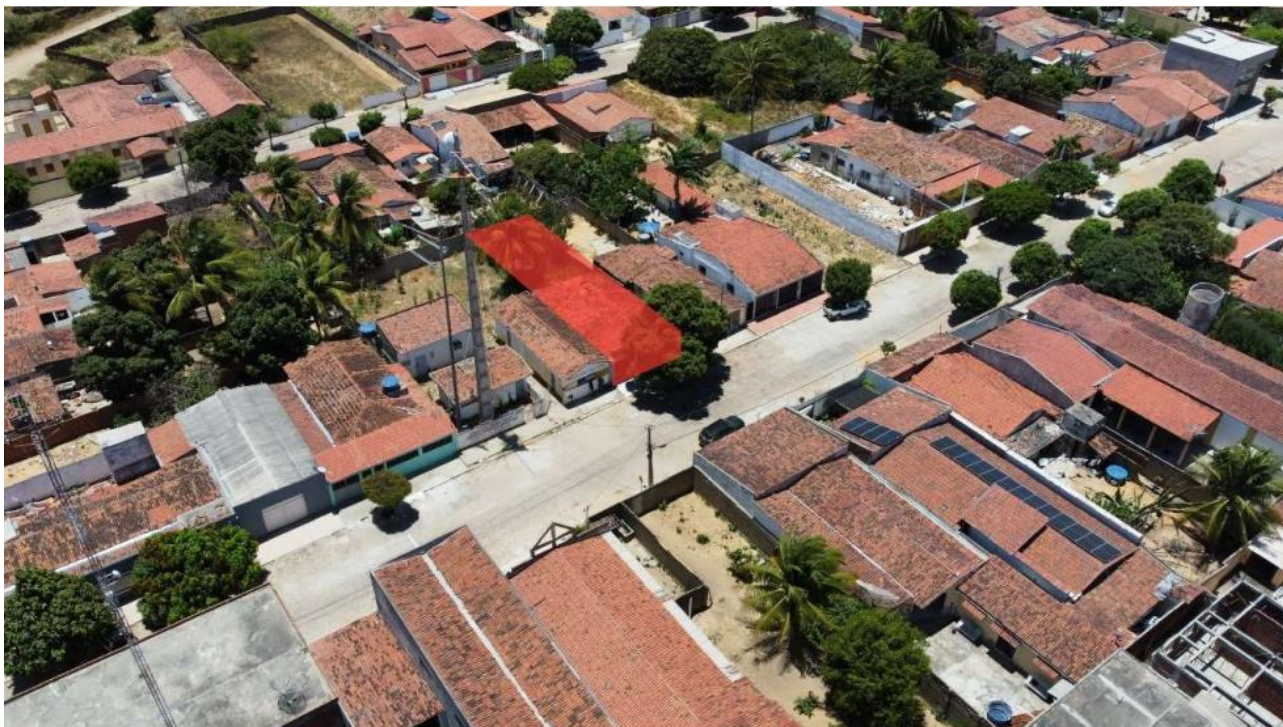
Imagem 6: Vista aérea do local.