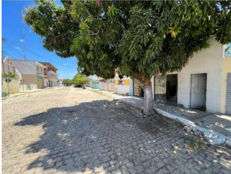
Imagem 3: Vista da fachada.