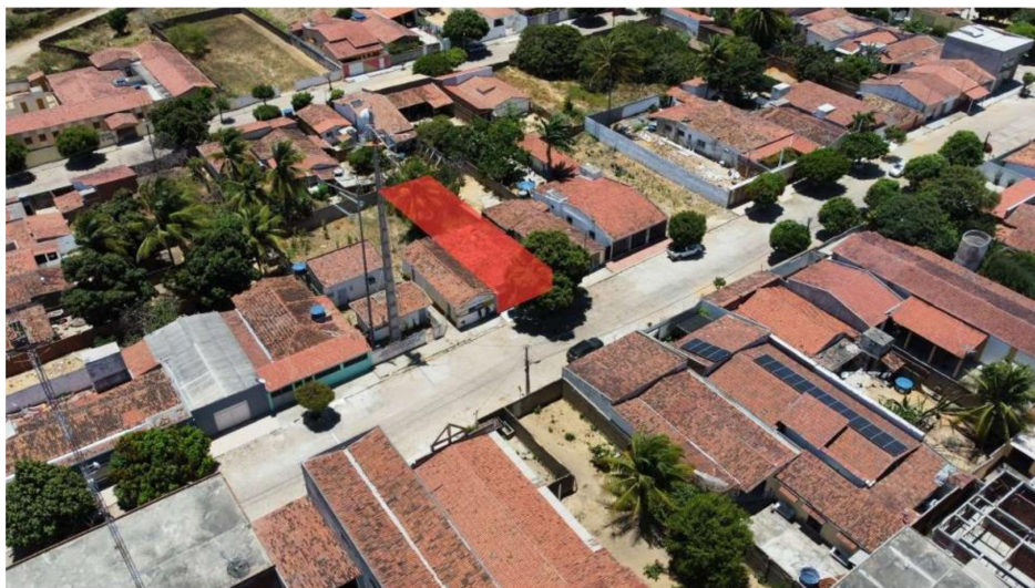
Imagem 6: Vista aérea do local.