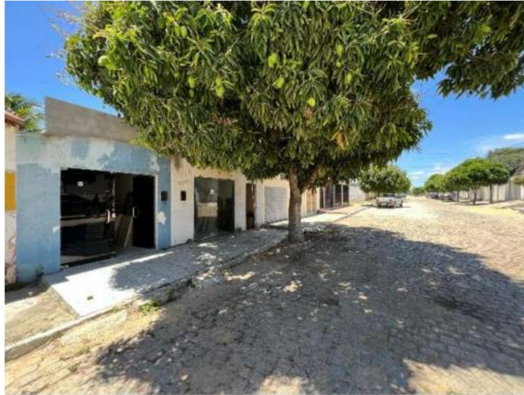
Imagem 2: Vista da fachada.