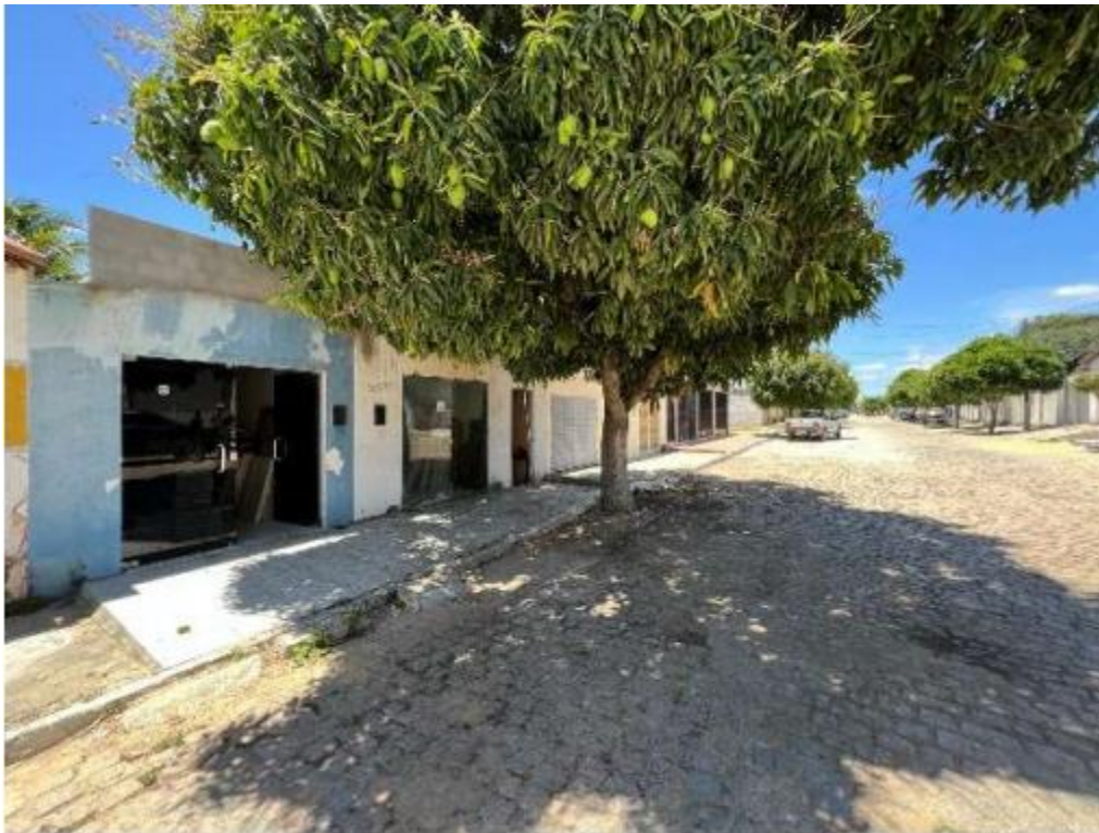
Imagem 2: Vista da fachada.