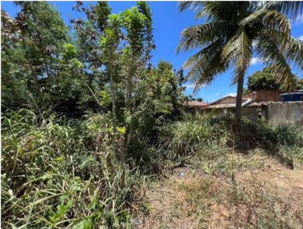
Imagem 4: Quintal.