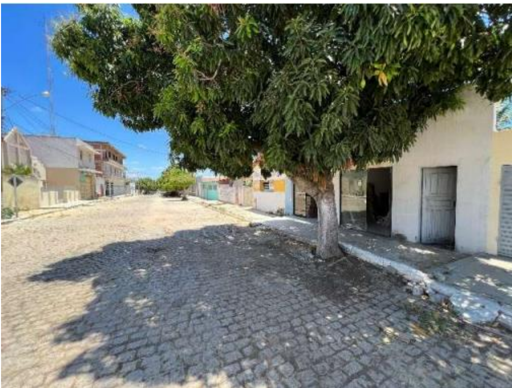
Imagem 3: Vista da fachada.