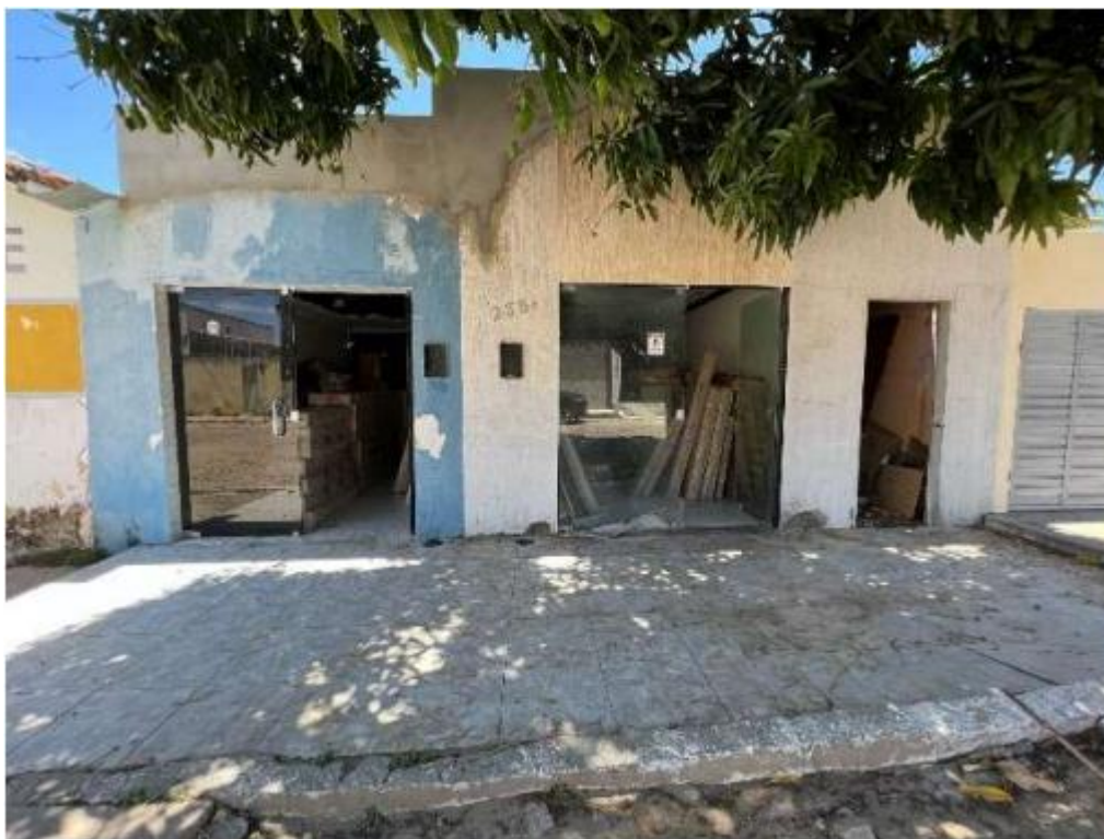
Imagem 1: Vista da fachada.

2.1.2. A área de realização dos serviços possui edificação a ser demolida com cerca de 120,00m 2 , conforme imagens abaixo: