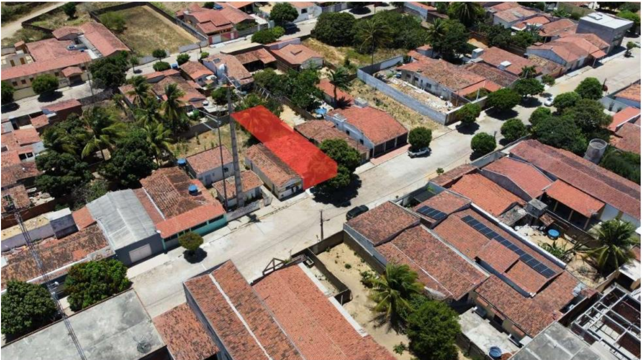
Imagem 6: Vista aérea do local.